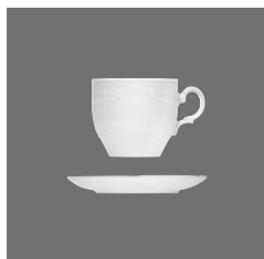
Tasse, Cup and saucer, Tasse et soucoupe, Taza y platito, Tazza e piattino