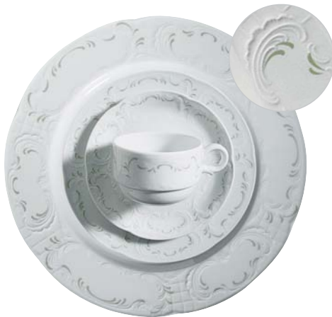
323770 Residenz Seladon