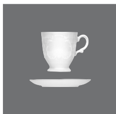
Tasse, Cup and saucer, Tasse et soucoupe, Taza y platito, Tazza e piattino