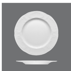
Teller flach flache Fahne, Plate flat with flat rim, Assiette plate avec aile plate, Plato llano con ala plana, Piatto piano con falda bassa