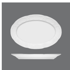
Platte oval Fahne , Platter oval with rim, Plat ovale avec aile, Fuente oval con ala, Piatto ovale