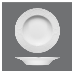
Teller tief steile Fahne , Plate deep with steep rim, Assiette creuse avec aile relevée, Plato hondo con ala empinada, Piatto fondo con falda alta