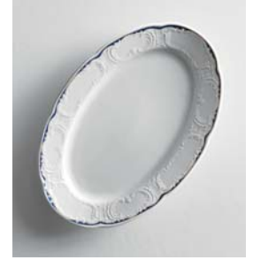
Dekor Zarensaal (410790)