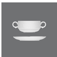
Suppentasse stapelbar, Cream soup cup stackable and saucer, Tasse à consommé empilable et soucoupe, Taza consomé apilable y platito, Tazza brodo impilabile e piattino