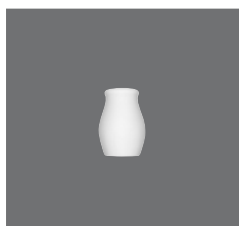
Salz- / Pfefferstreuer , Salt / Pepper shaker, Salière / Poivrière, Salero / Pimentero, Spargi sale / Spargi pepe