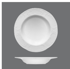
Teller halbtief flache Fahne , Plate half-deep with flat rim, Assiette demi-creuse avec aile plate, Plato medio hondo con ala plana, Piatto semifondo con falda bassa