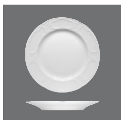
Teller flach steile Fahne, Plate flat with steep rim, Assiette plate avec aile relevée, Plato llano con ala empinada, Piatto piano con falda alta