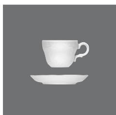
Tasse, Cup and saucer, Tasse et soucoupe, Taza y platito, Tazza e piattino