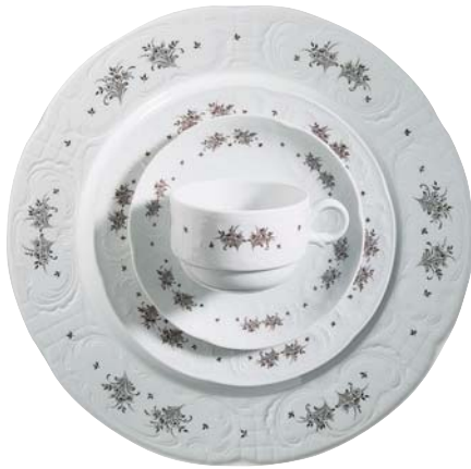
322240 Brauner Streuer