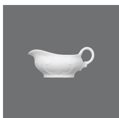
Saucenschälchen , Sauce-boat small, Saucière petite, Salsera pequeña, Salsiera piccola