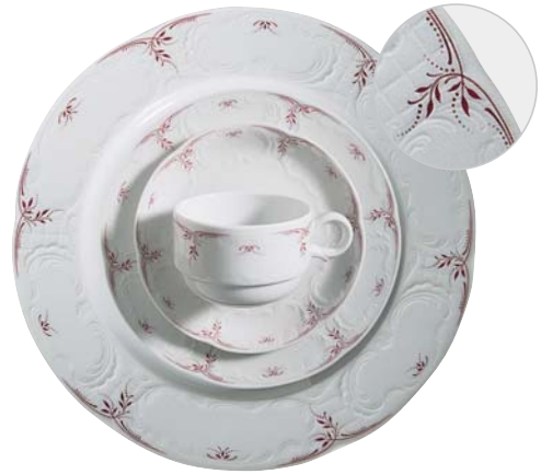
322540 Rote Zweige