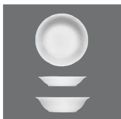
Schale rund , Bowl round, Bol rond, Bowl redondo, Coppetta rotonda