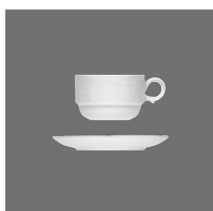
Tasse stapelbar, Cup stackable and saucer, Tasse empilable et soucoupe, Taza apilable y platito, Tazza impilabile e piattino